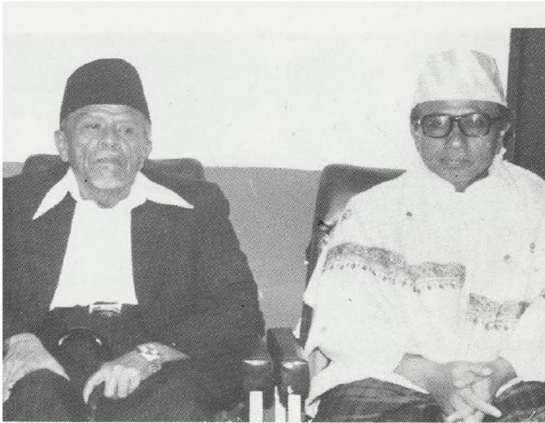
Prof. Dr. Hamka dengan Abah Anom.